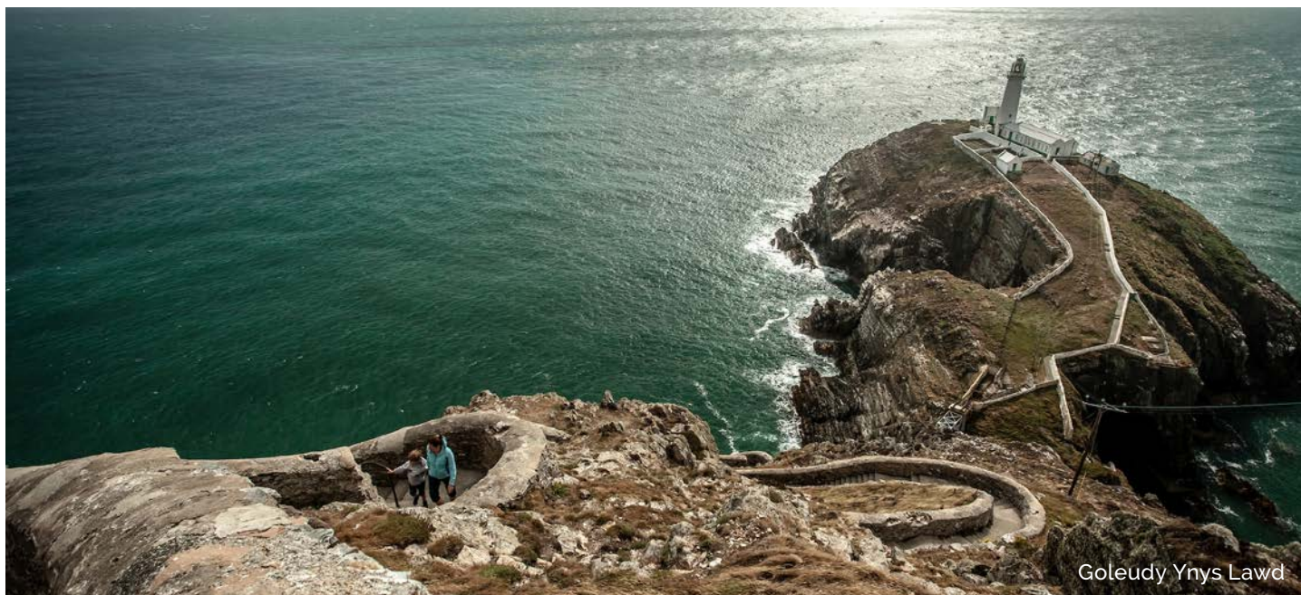
Goleudy Ynys Lawd