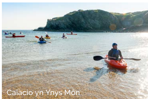
Caiacio yn Ynys Môn