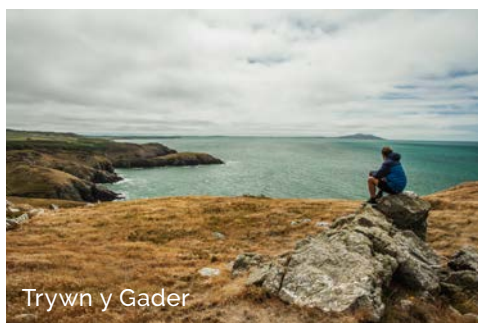
Trywn y Gader